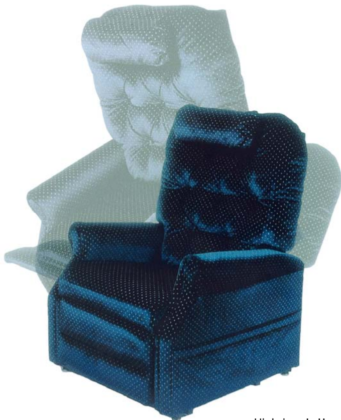
Highriser I, II